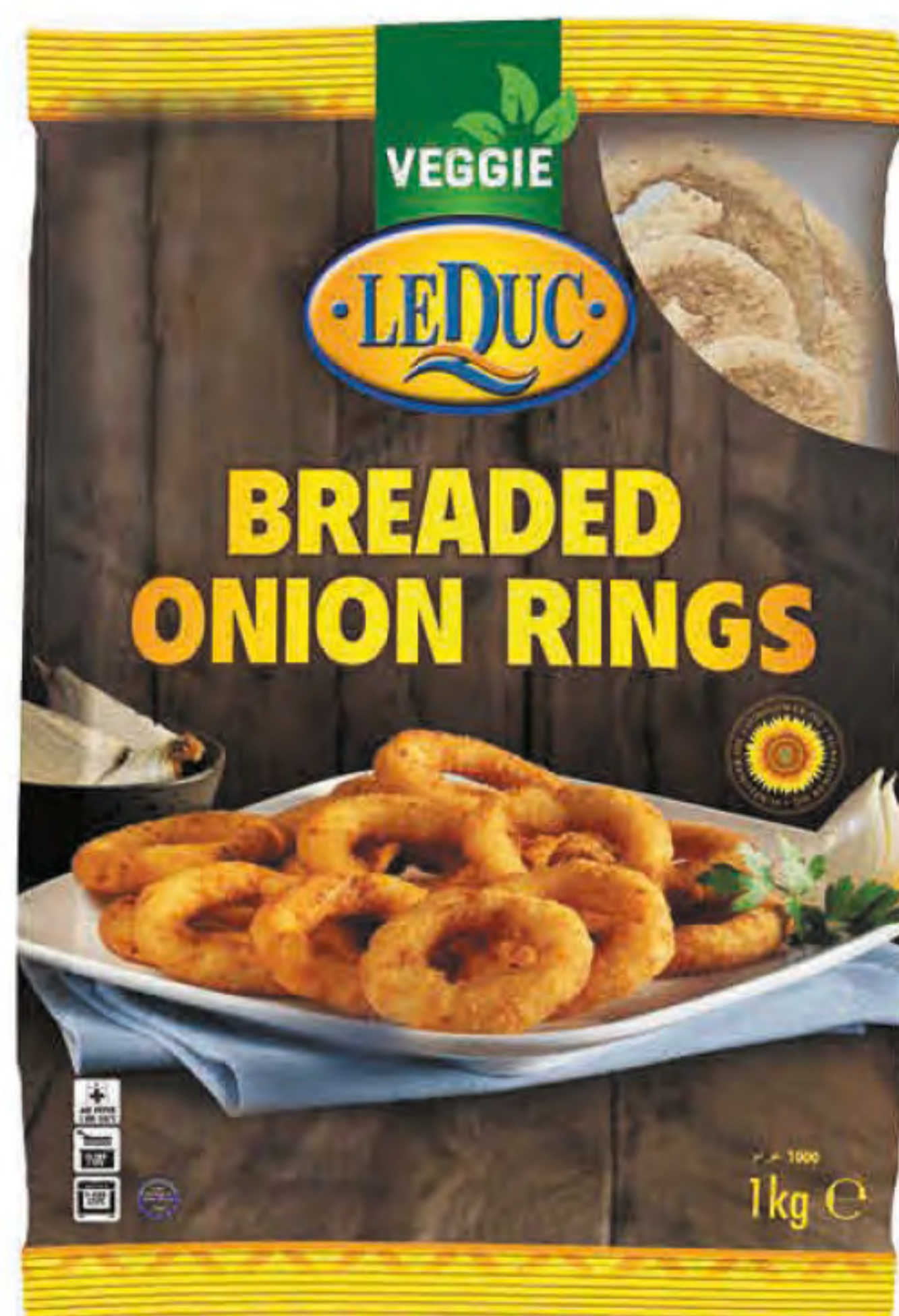
BREADED ONION RINGS 6 x 1000 gram