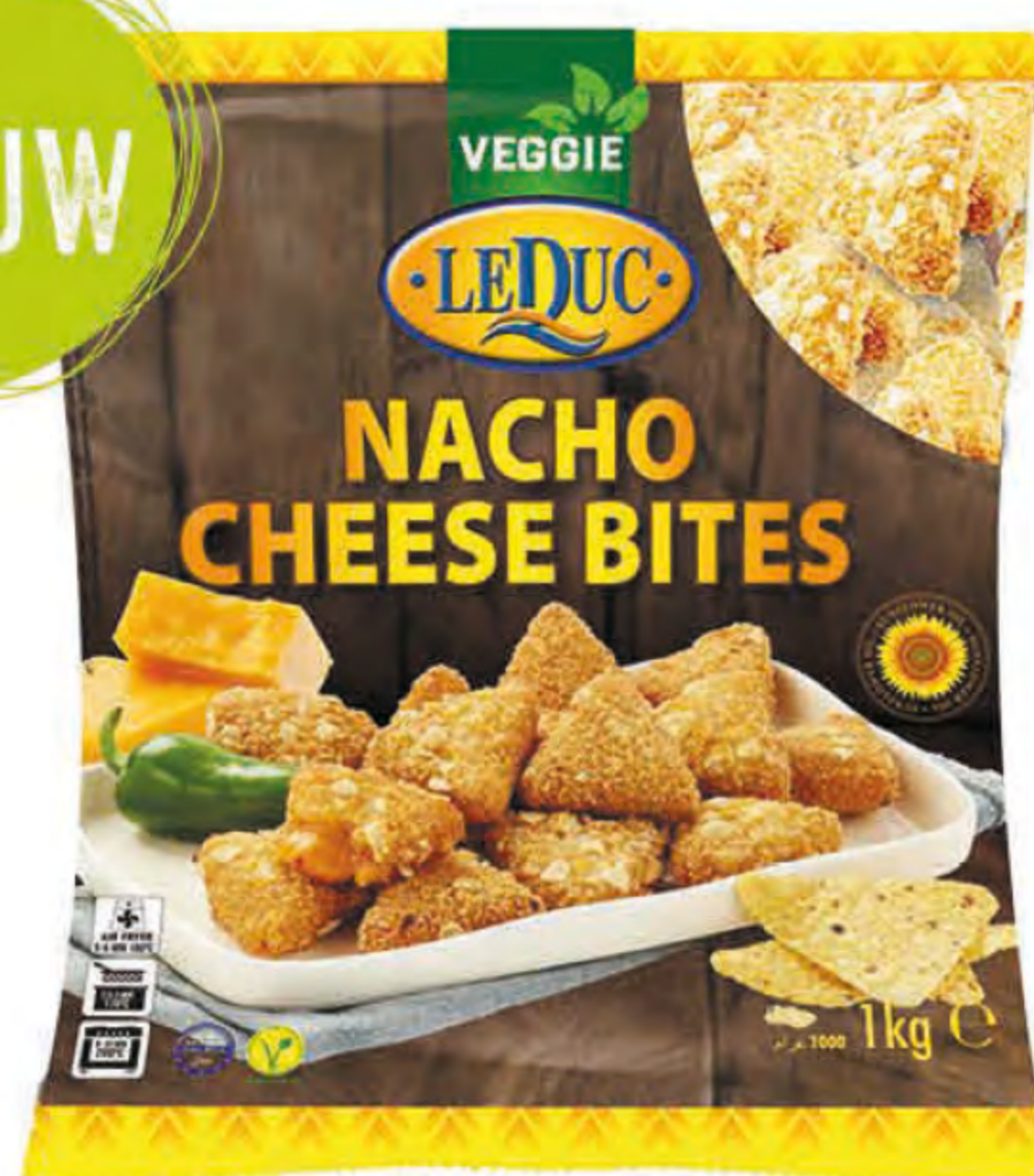
NACHO CHEESE BITES 6 x 1000 gram