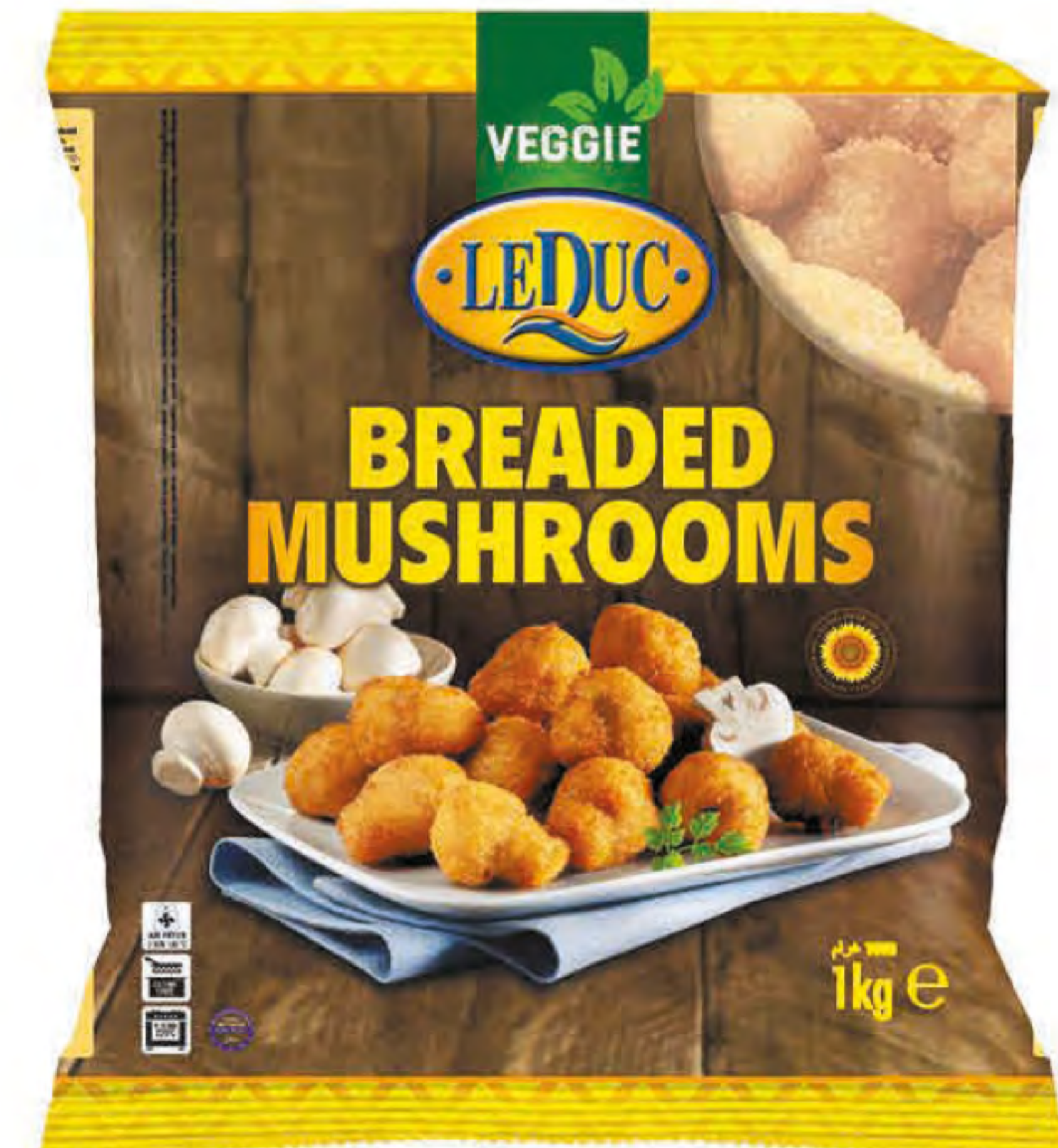
BREADED MUSHROOMS 5 x 1000 gram