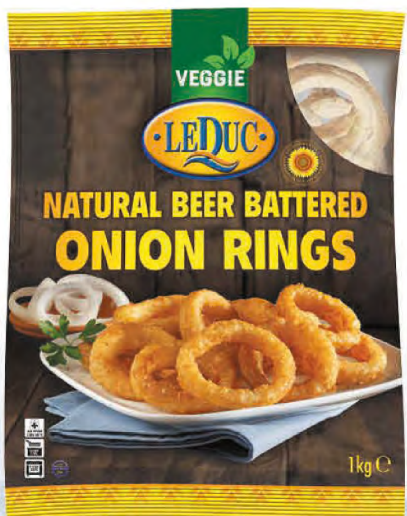
NATURAL BEER BATTERED ONION RINGS 6 x 1000 gram