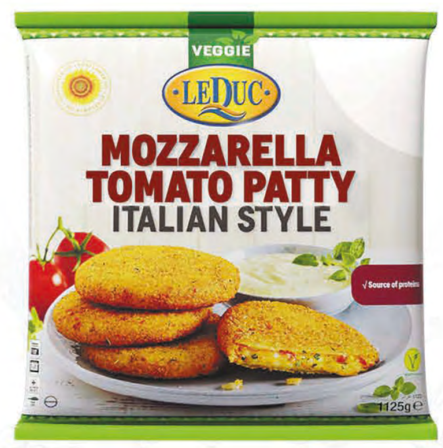
MOZZARELLA TOMATO PATTY ITALIAN STYLE 7 x 1125 gram