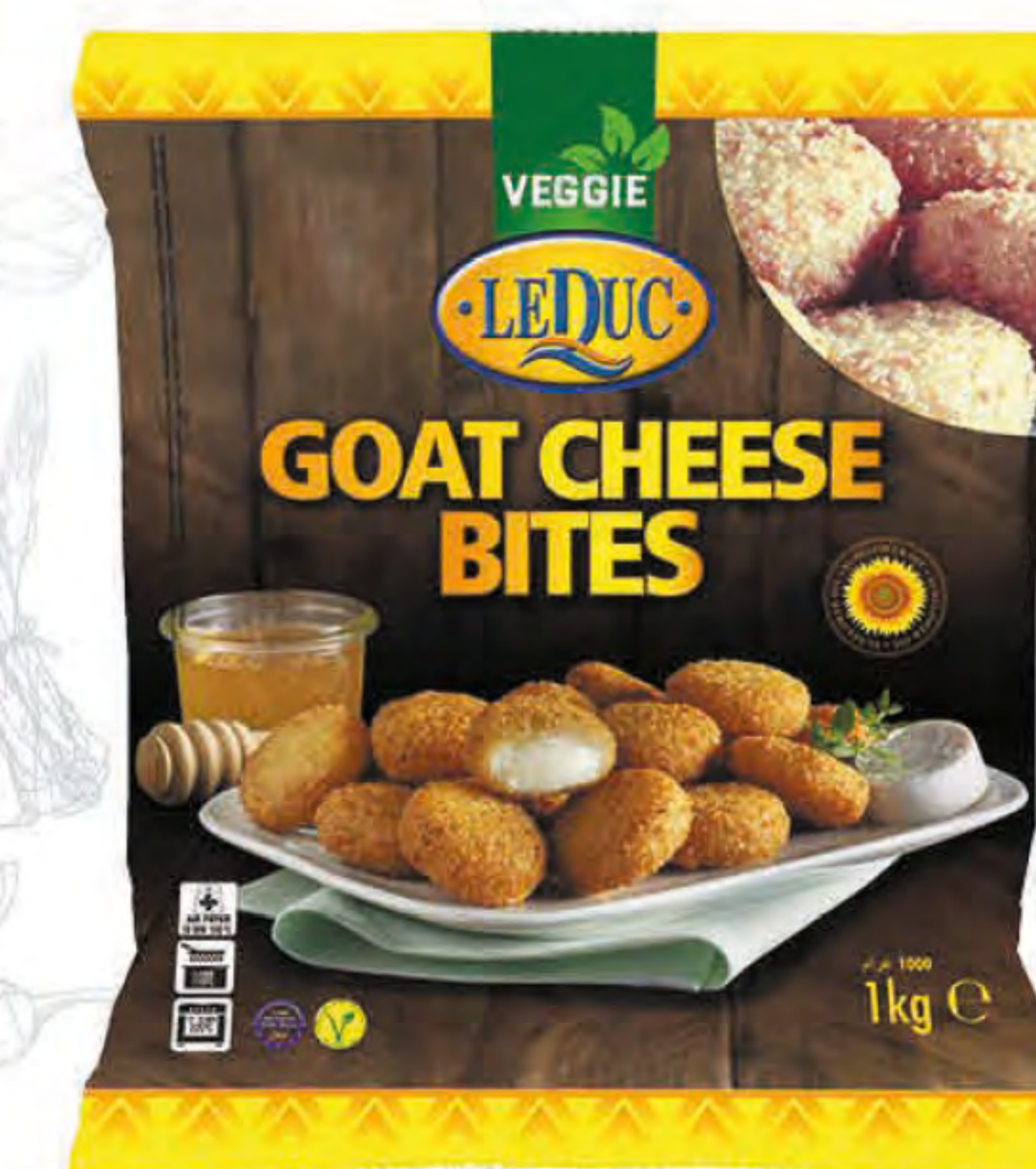
GOAT CHEESE BITES 6 x 1000 gram