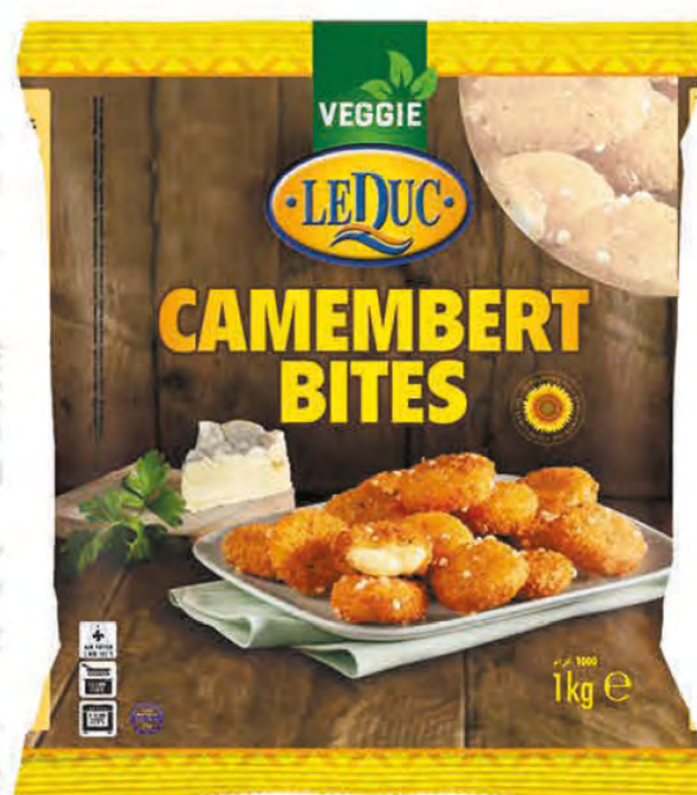
CAMEMBERT BITES 6 x 1000 gram