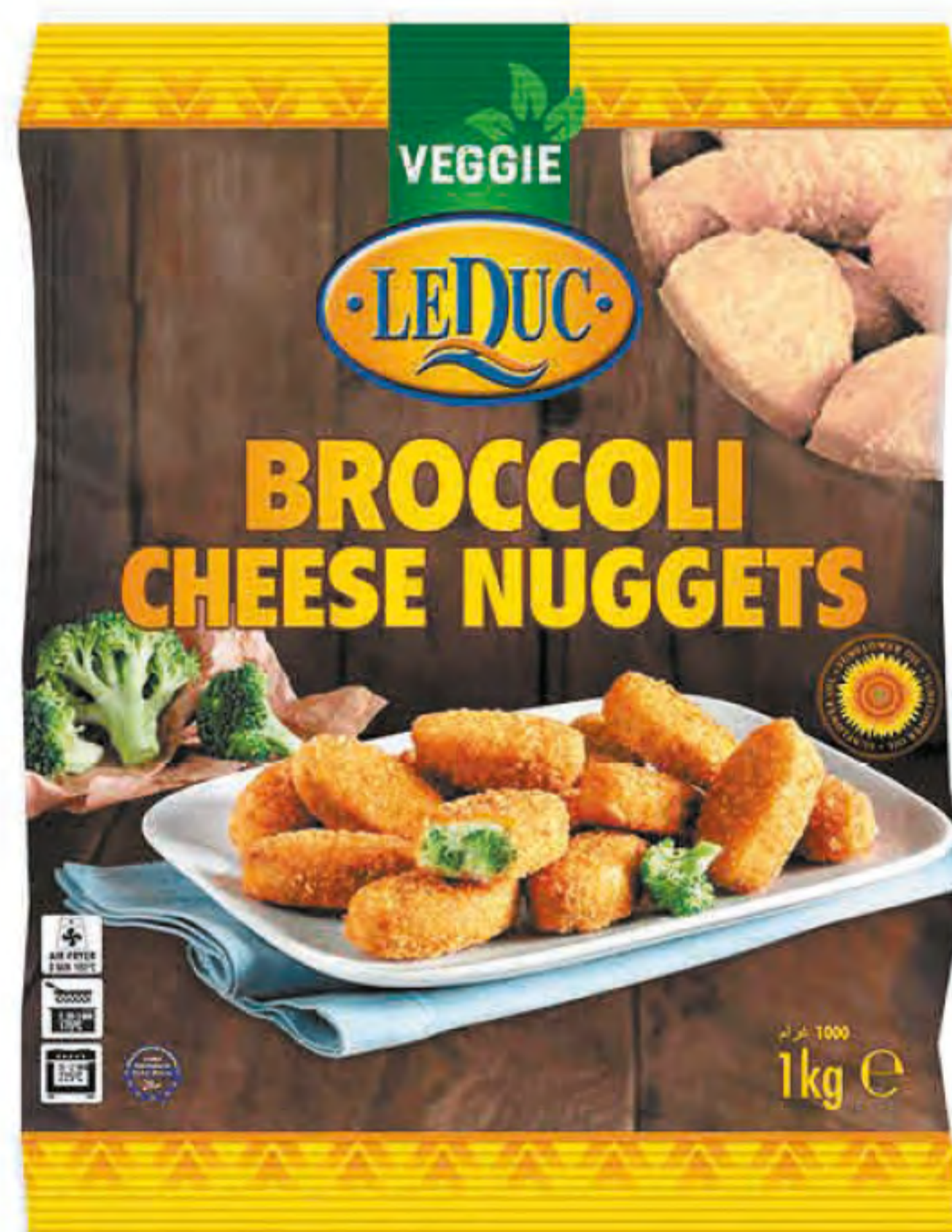
BROCCOLI CHEESE NUGGETS 6 x 1000 gram