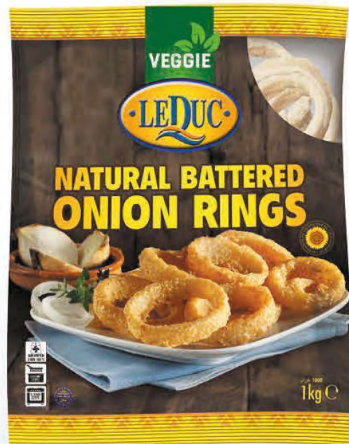
NATURAL BATTERED ONION RINGS 6 x 1000 gram