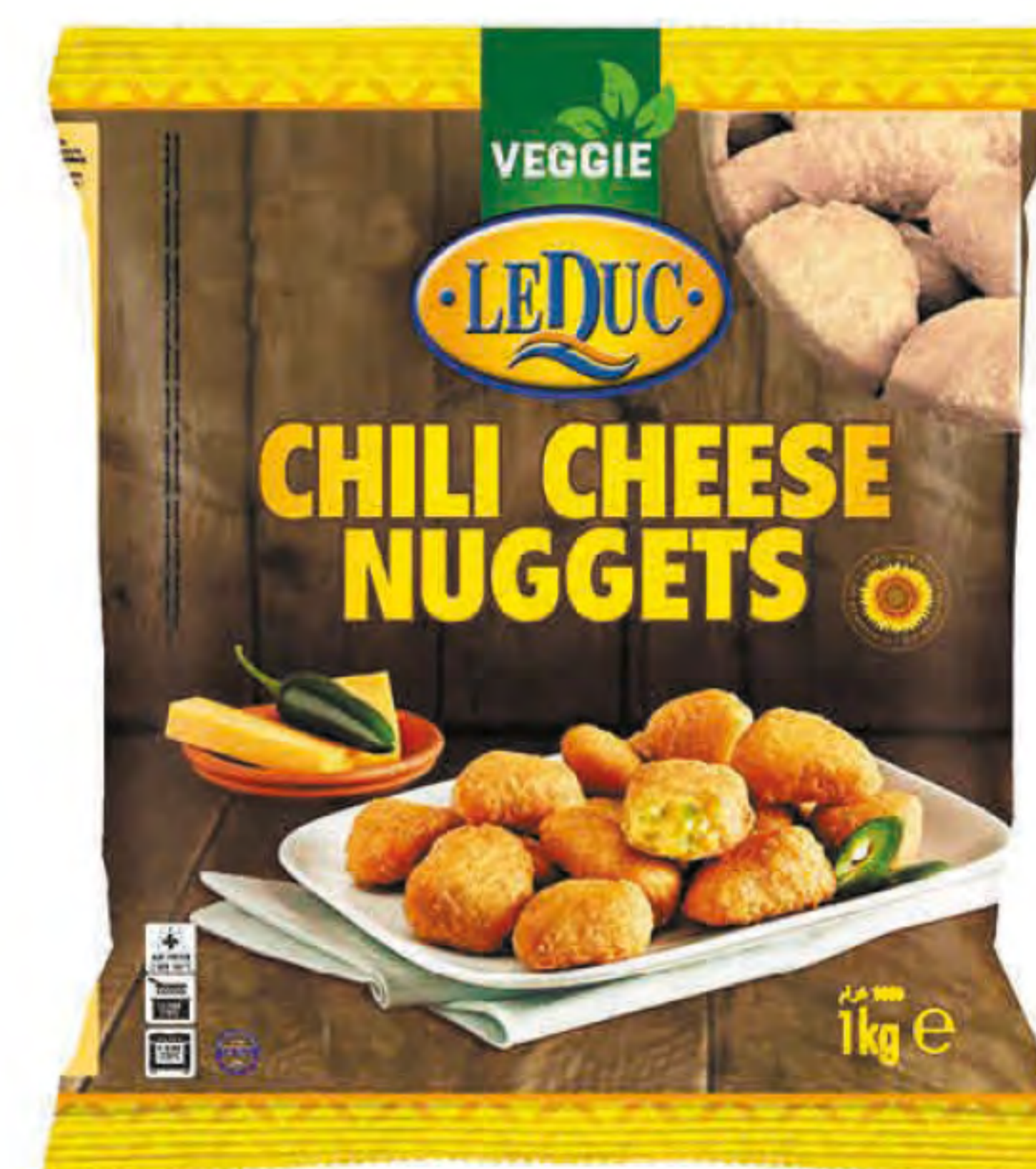
CHILI CHEESE NUGGETS 6 x 1000 gram