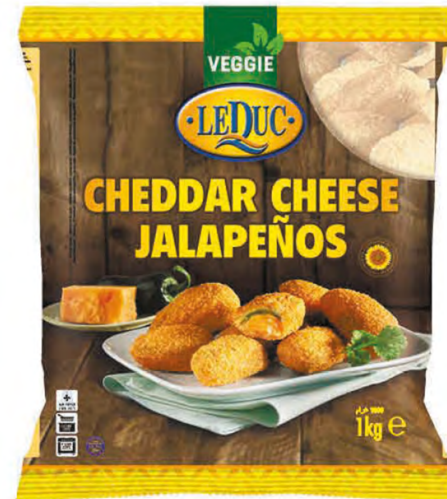
CHEDDAR CHEESE JALAPEÑOS 6 x 1000 gram