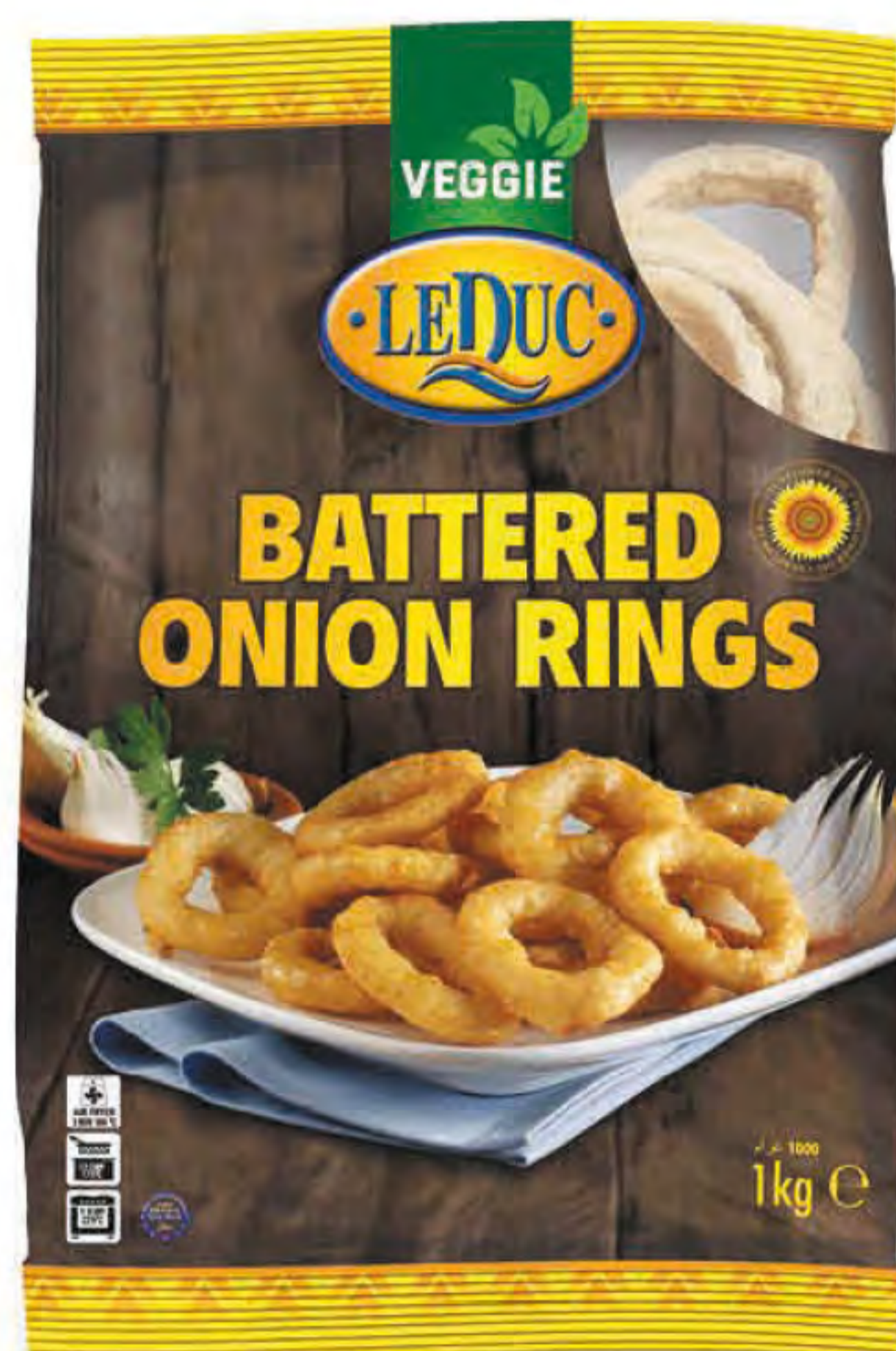
BATTERED ONION RINGS 6 x 1000 gram