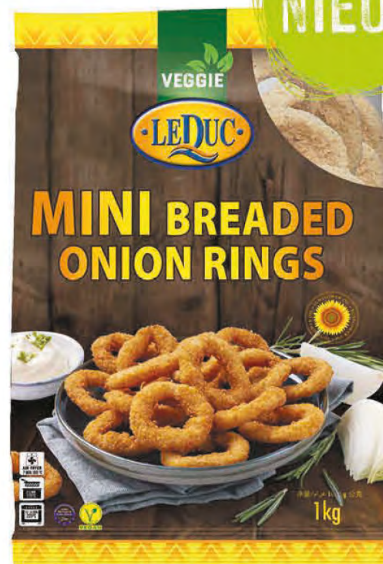
MINI BREADED ONION RINGS 6 x 1000 gram