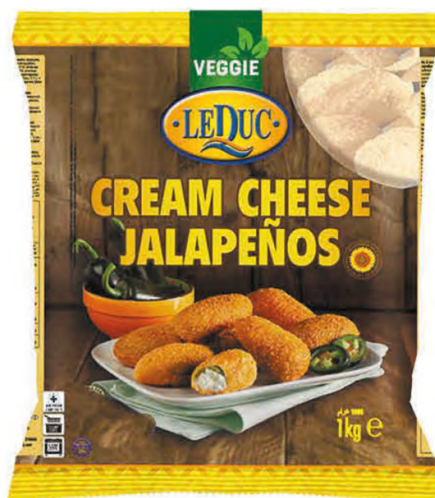
CREAM CHEESE JALAPEÑOS 6 x 1000 gram