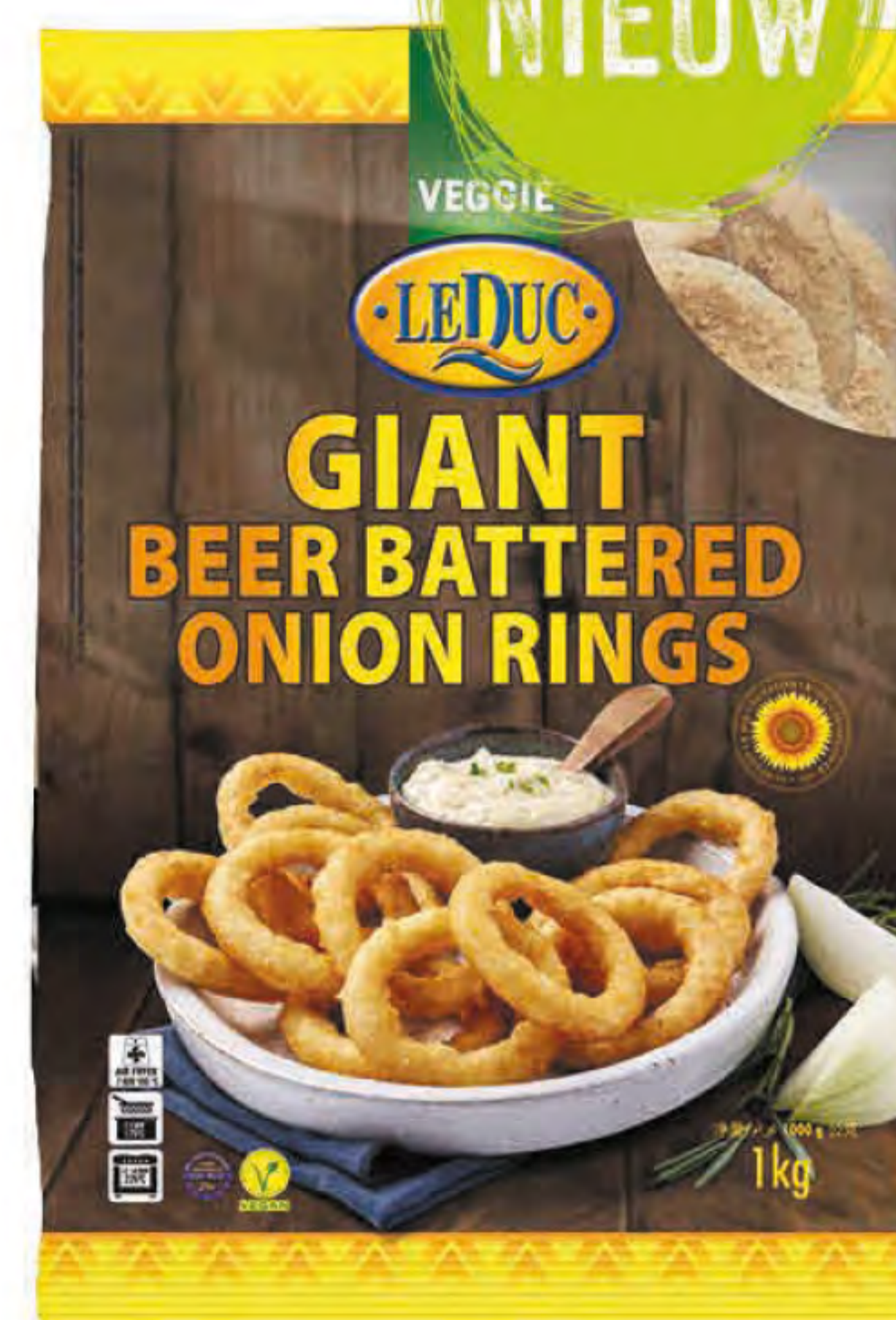
GIANT BEER BATTERED ONION RINGS 6 x 1000 gram