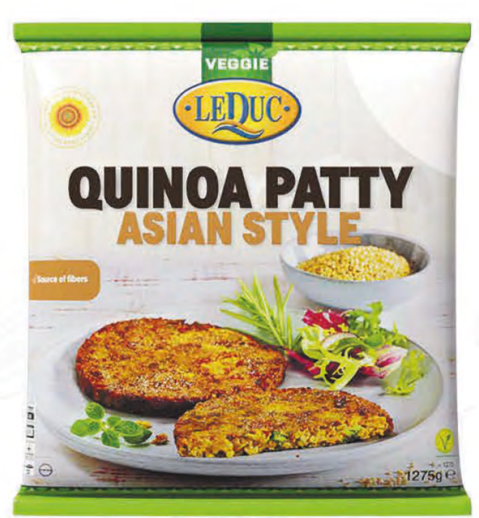
QUINOA PATTY ASIAN STYLE 6 x 1275 gram