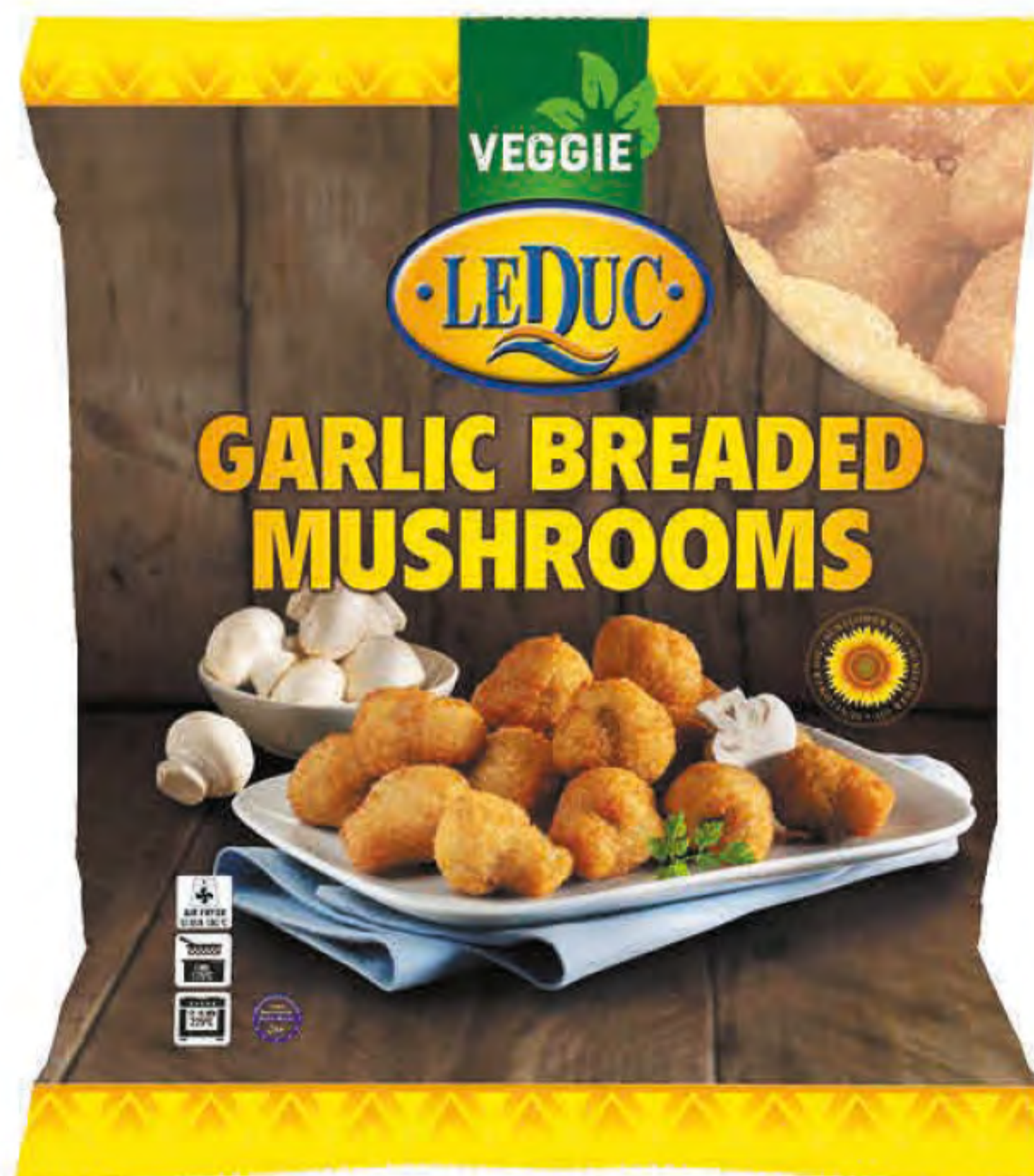
GARLIC BREADED MUSHROOMS 5 x 1000 gram