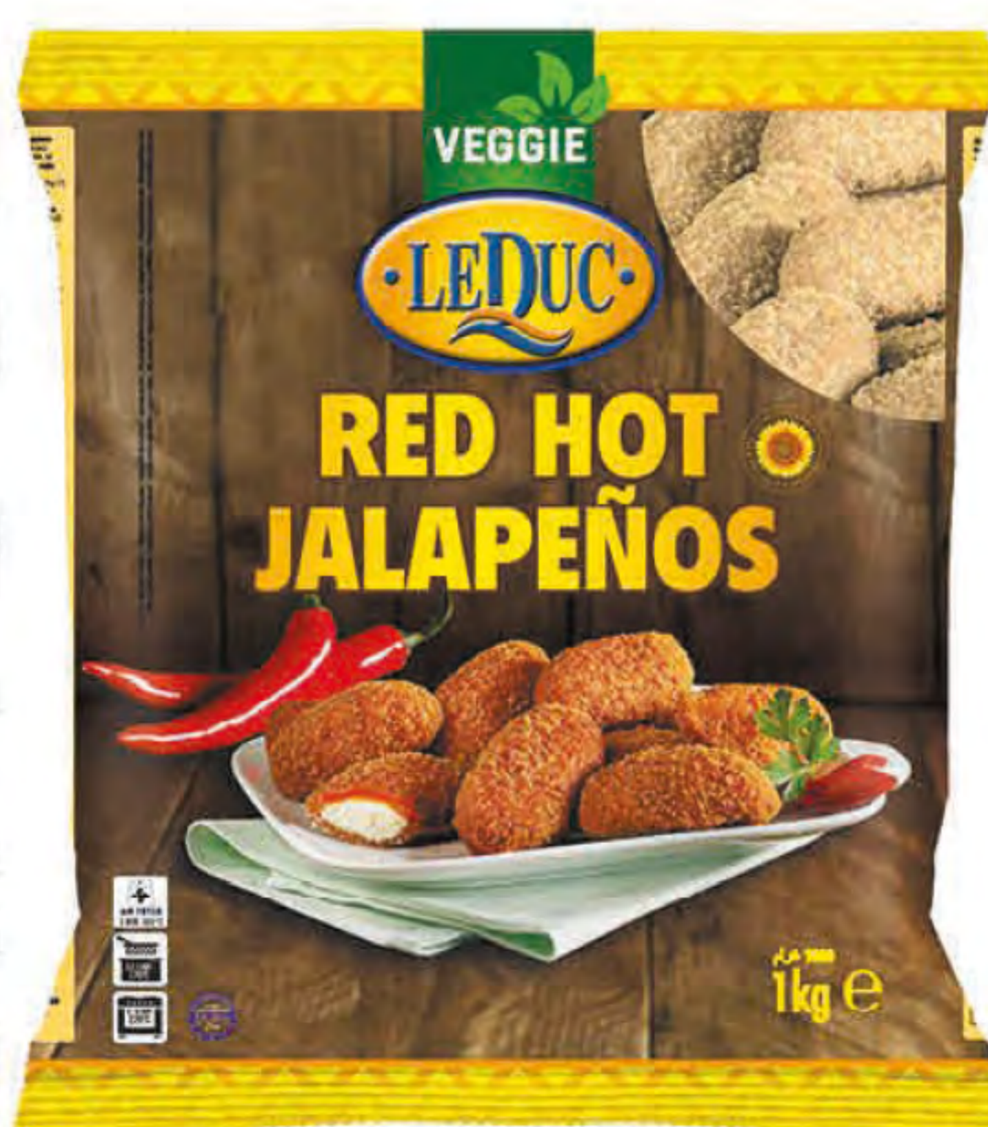
RED HOT JALAPEÑOS 6 x 1000 gram