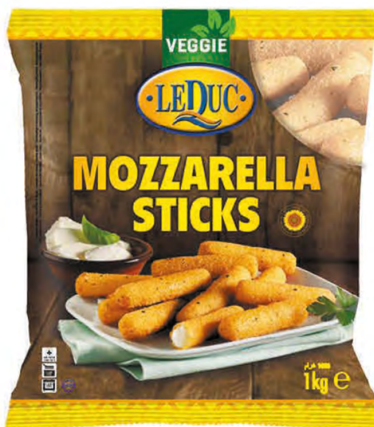
MOZZARELLA STICKS 6 x 1000 gram