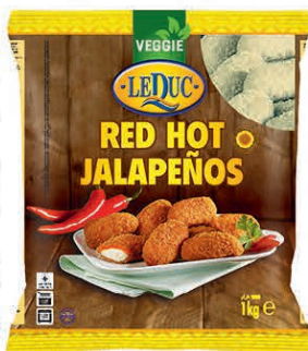
RED HOT JALAPEÑOS 6 x 1000 gram