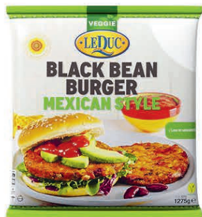
BLACK BEAN BURGER MEXICAN STYLE 6 x 1275 gram