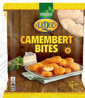
CAMEMBERT BITES 6 x 1000 gram