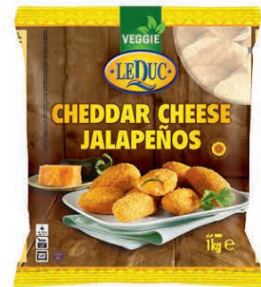
CHEDDAR CHEESE JALAPEÑOS 6 x 1000 gram