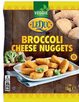
BROCCOLI CHEESE NUGGETS 6 x 1000 gram