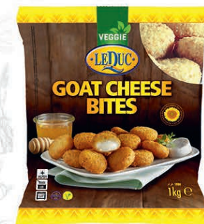
GOAT CHEESE BITES 6 x 1000 gram