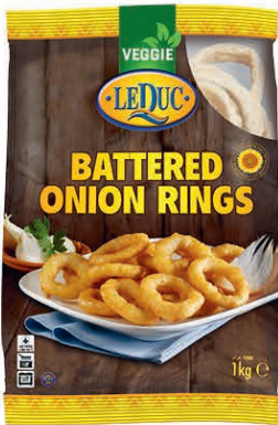
BATTERED ONION RINGS 6 x 1000 gram