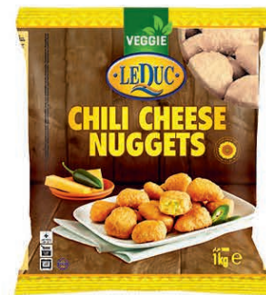
CHILI CHEESE NUGGETS 6 x 1000 gram