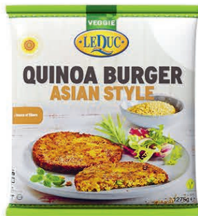
QUINOA BURGER ASIAN STYLE 6 x 1275 gram