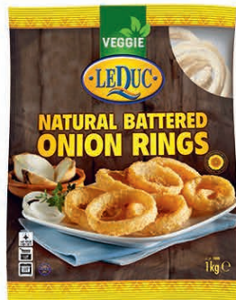
NATURAL BATTERED ONION RINGS 6 x 1000 gram