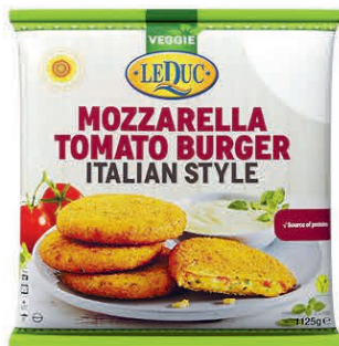
MOZZARELLA TOMATO BURGER ITALIAN STYLE 7 x 1125 gram