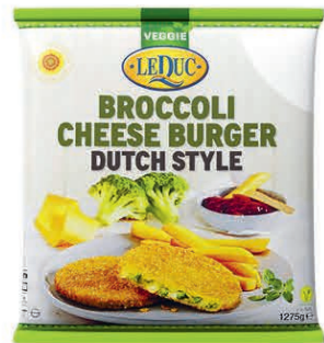
BROCCOLI CHEESE BURGER DUTCH STYLE 6 x 1275 gram