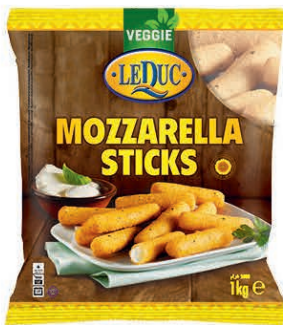
MOZZARELLA STICKS 6 x 1000 gram