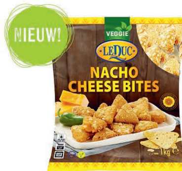
NACHO CHEESE BITES 6 x 1000 gram