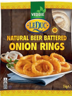
NATURAL BEER BATTERED ONION RINGS 6 x 1000 gram