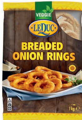
BREADED ONION RINGS 6 x 1000 gram