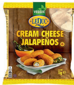
CREAM CHEESE JALAPEÑOS 6 x 1000 gram